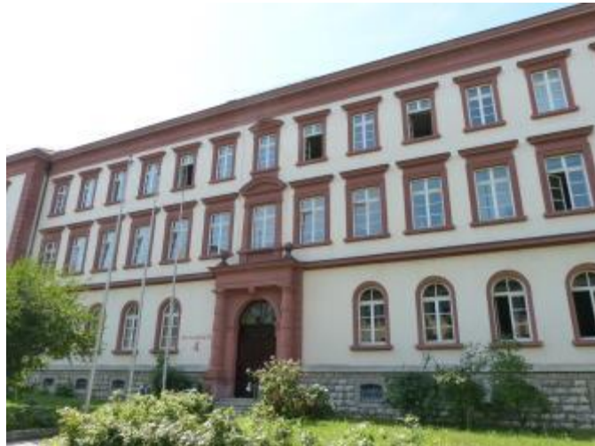
Vernetzungsstelle Kita- und Schulverpflegung Unterfranken

Wir informieren, qualifizieren, motivieren und vernetzen Akteure und Multiplikatoren in der Gemeinschaftsverpflegung.